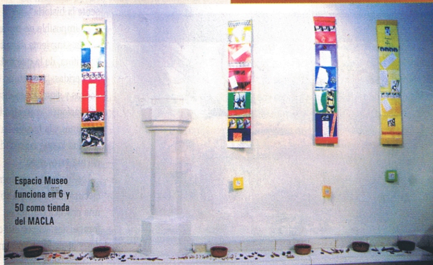
Espacio Museo funciona en 6 y 50 como tienda del MACLA

■ Diagonal 77 y 3. Lunes a viernes de 16 a 20. En internet: www.residenciacorazon.com.ar